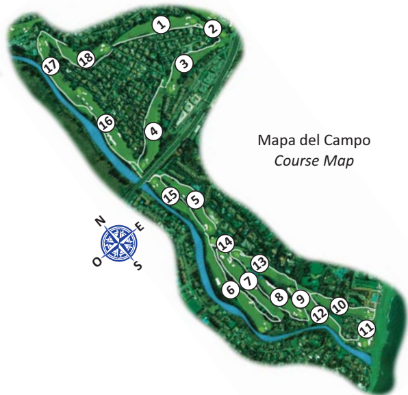
Mapa del Campo Course Map