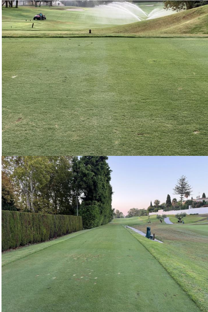
Aspecto general de los tees.

A continuación, se detallan las labores culturales que se van a realizar: