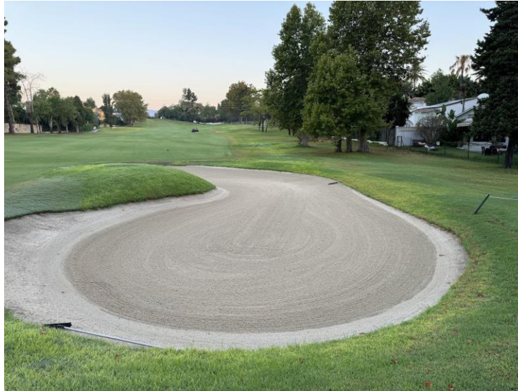
Aspecto general de las bunker

A continuación, se detallan las labores culturales realizadas en los bunkers: