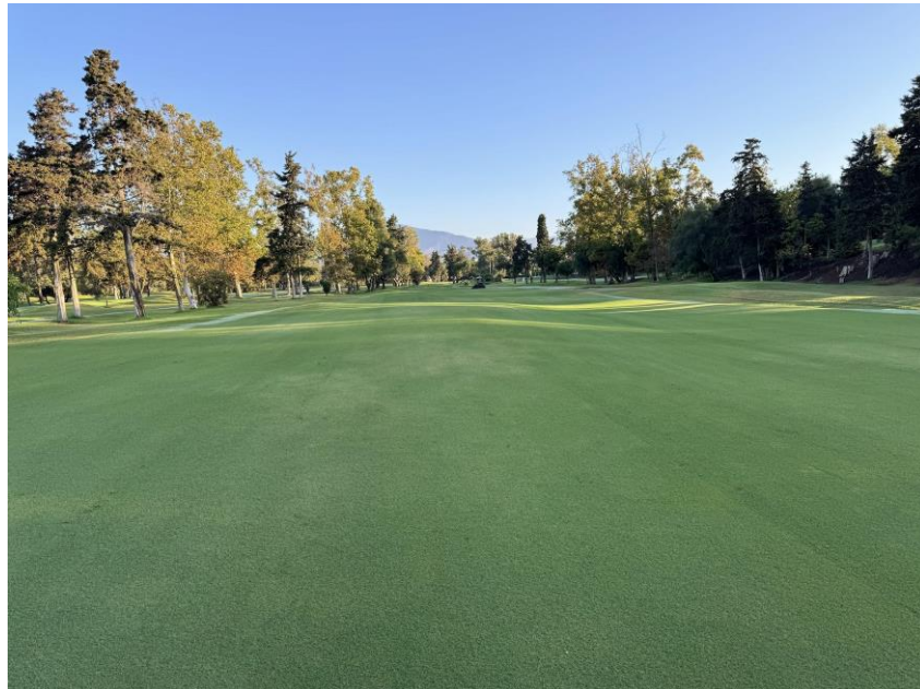
Aspecto general de las calles.

El estado general de las calles y el rough es adecuado, uniformes, densos y con unas adecuadas condiciones de juego. Todo ello gracias a la inyección de arena y la eliminación del kikuyu en los fairways.