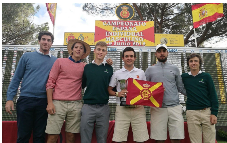
6 participantes del club en el Campeonato España Masculino Absoluto